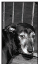
Véronique (M) Arrivée le 30/11/2006 Âgée de huit ans